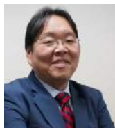
JULIO KOSAKA VICEMINISTRO MINISTERIO DE VIVIENDA, CONSTRUCCIÓN Y SANEAMIENTO PERÚ