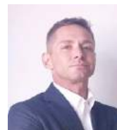
Gerente Desarrollo Negocio Internacional GS INIMA ESPAÑA