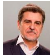
Presidente - AEDYR Gerente Técnico e Innovación Sacyr Water Services ESPAÑA